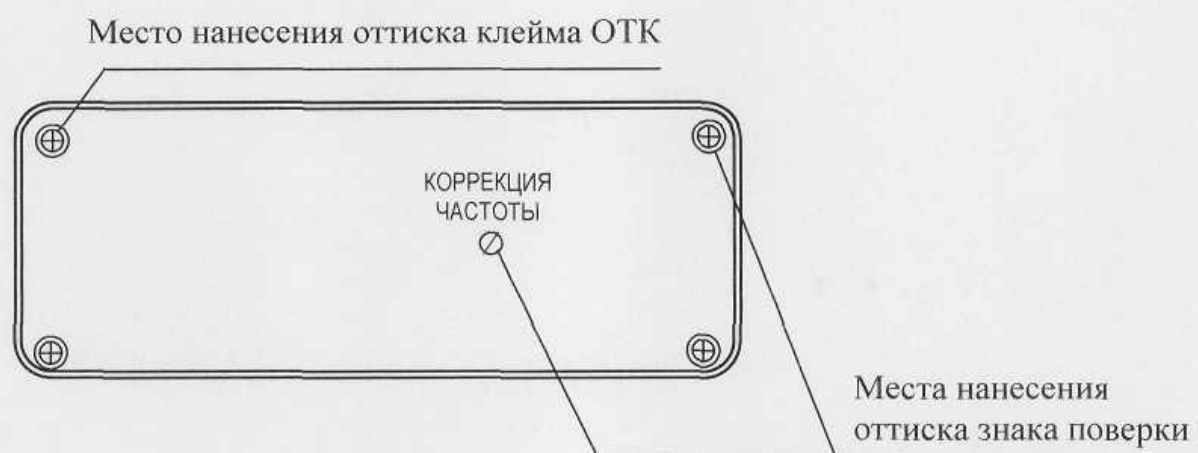
Рисунок А.1 – Место нанесения оттиска знака поверки (вид частотомера сзади)