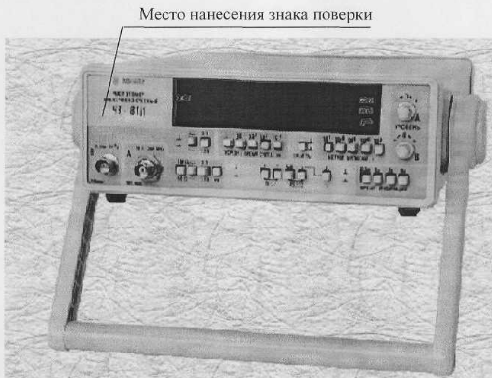
Рисунок А.2 – Место нанесения знака поверки (лицевая панель частотомера)