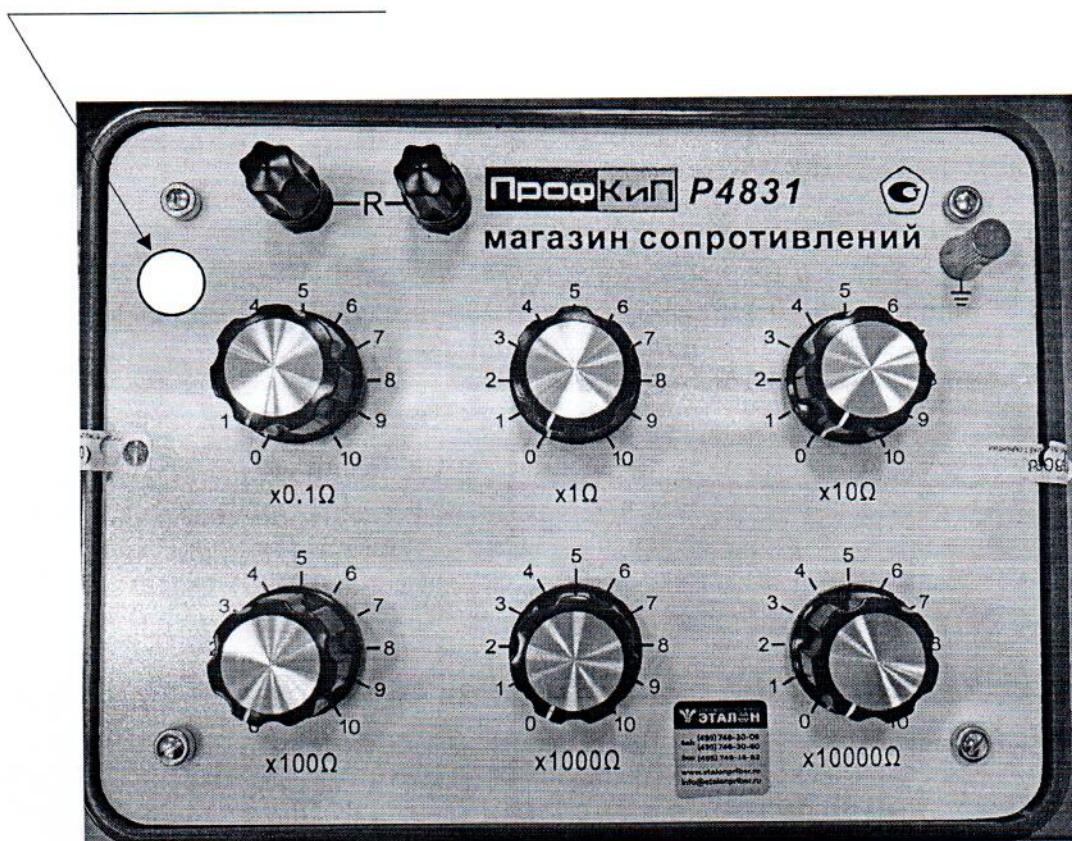
Рисунок 2.1 – Место нанесения знака поверки магазина сопротивлений ПрофКиП Р4831 № В3398

место для нанесения знака поверки в виде клейма-наклейки