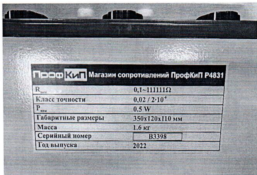
Рисунок 1.1 – Внешний вид магазина сопротивлений ПрофКип Р4831 № В3398