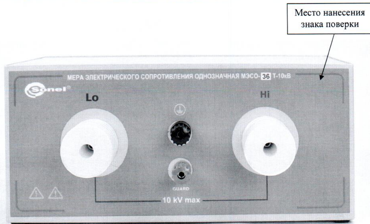
Рисунок 1 – Общий вид мер и место нанесения знака поверки

Общий вид мер и место нанесения знака поверки представлены на рисунке 1. Место пломбирования от несанкционированного доступа представлено на рисунке 2.