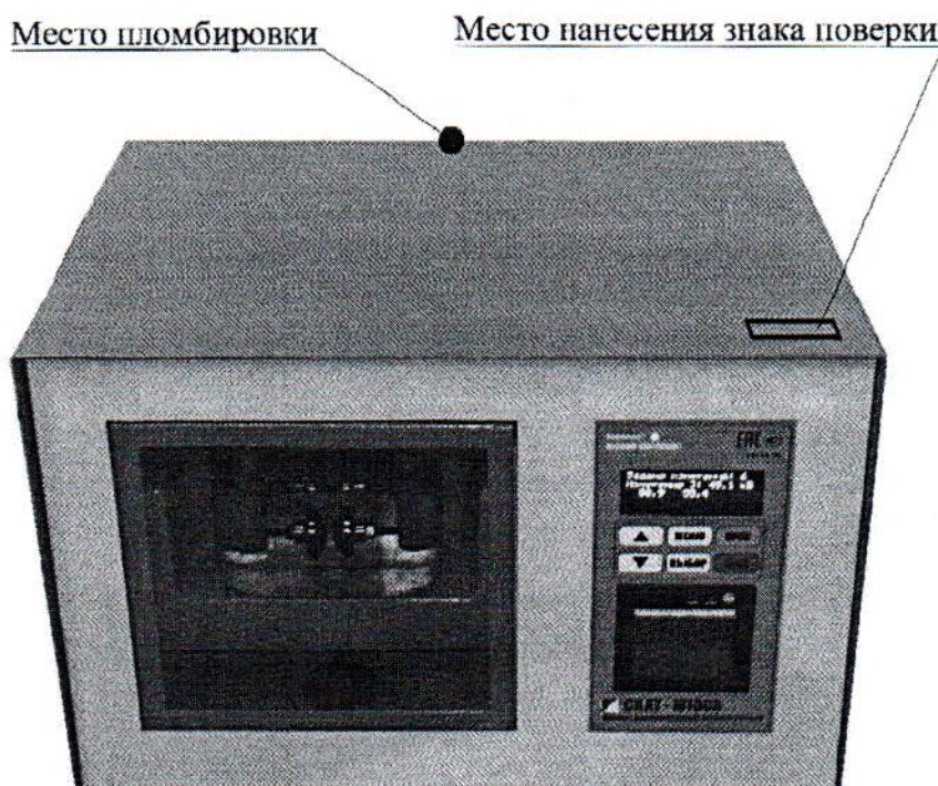
Рисунок 1 - Общий вид аппаратов высоковольтных испытательных СКАТ-M100B

Общий вид аппаратов высоковольтных испытательных СКАТ-M100B с указанием места пломбировки и места нанесения знака поверки представлен на рисунке 1.