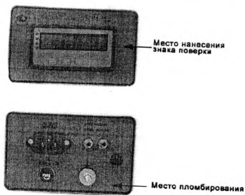
Рисунок 2 – Схема пломбирования