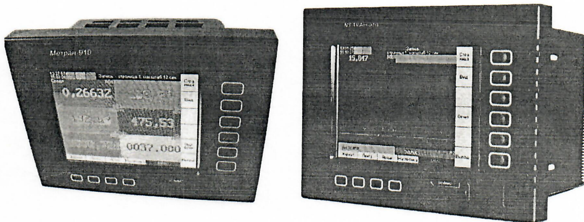
Рисунок 1 – Общий вид регистратора видеографического Метран-910

Фотографии общего вида регистратора представлены на рисунке 1.