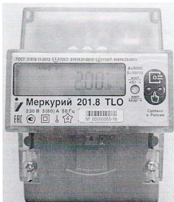
Рисунок 1 - Общий вид счётчиков «Меркурий 201.8TLO»

На рисунке 1 приведена фотография общего вида счётчиков «Меркурий 201.8TLO».