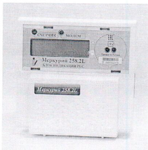
Рисунок 1 - Внешний вид блока индикации PLC

Внешний вид блока индикации PLC приведён на рисунке 1.