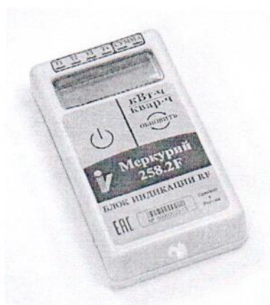
Рисунок 2 - Внешний вид блока индикации RF

Внешний вид блока индикации RF приведён на рисунке 2.