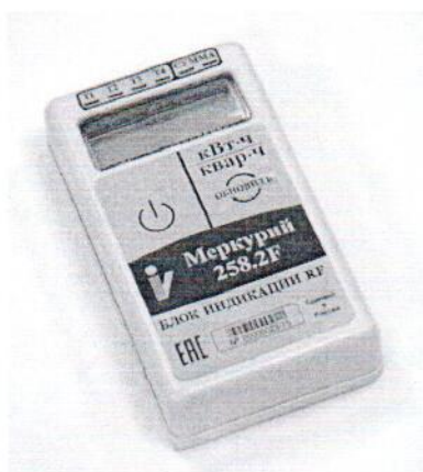
Рисунок 3 - Внешний вид блока индикации RF

Внешний вид блока индикации RF приведён на рисунке 3.