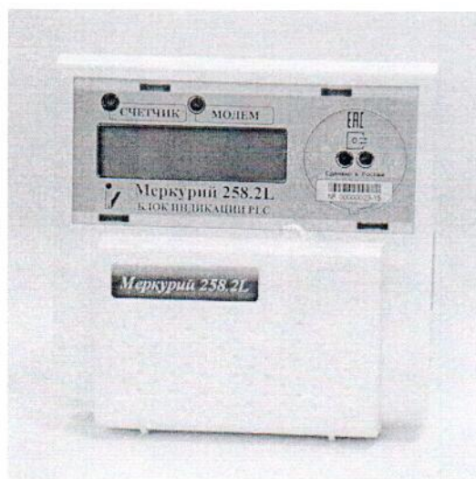
Рисунок 2 - Внешний вид блока индикации PLC

Внешний вид блока индикации PLC приведён на рисунке 2.