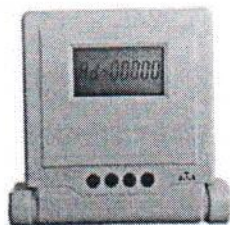
Рисунок 3. Внешний вид выносного модуля отображения информации

Счетчик ведет учет электрической энергии по действующим тарифам (до 4) в соответствии с месячными программами смены тарифных зон (количество месячных программ – до 12, количество тарифных зон в сутках – до 48). Месячная программа может содержать суточные графики тарификации рабочих, субботних, воскресных и специальных дней. Количество специальных дней (праздничные и перенесенные дни) – до 45. Для специальных дней могут быть заданы признаки рабочей, субботней, воскресной или специальной тарифной программы. Счетчик со-