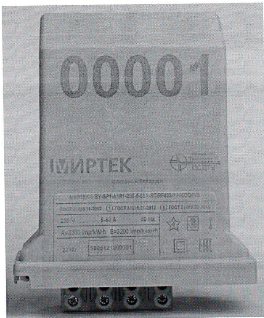
Рисунок 2. Внешний вид счетчика в корпусе модификации SP1