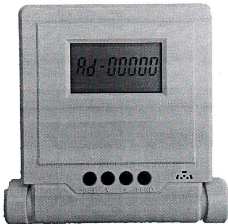
Рисунок 3. Внешний вид выносных модулей отображения информации