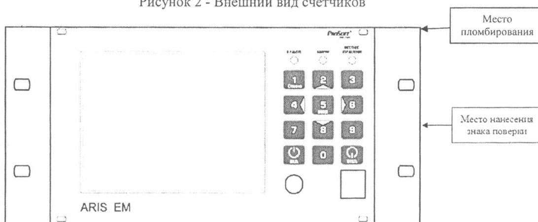
Рисунок 3 - Места пломбирования и нанесения знака поверки