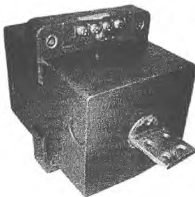
Рис. 1 - Фотография общего вида трансформаторов тока ТПК-10.

Принцип действия трансформаторов заключается в преобразовании переменного тока промышленной частоты в переменный ток для измерения с помощью стандартных измерительных приборов, а также обеспечении гальванического разделения измерительных приборов от цепи высокого напряжения.