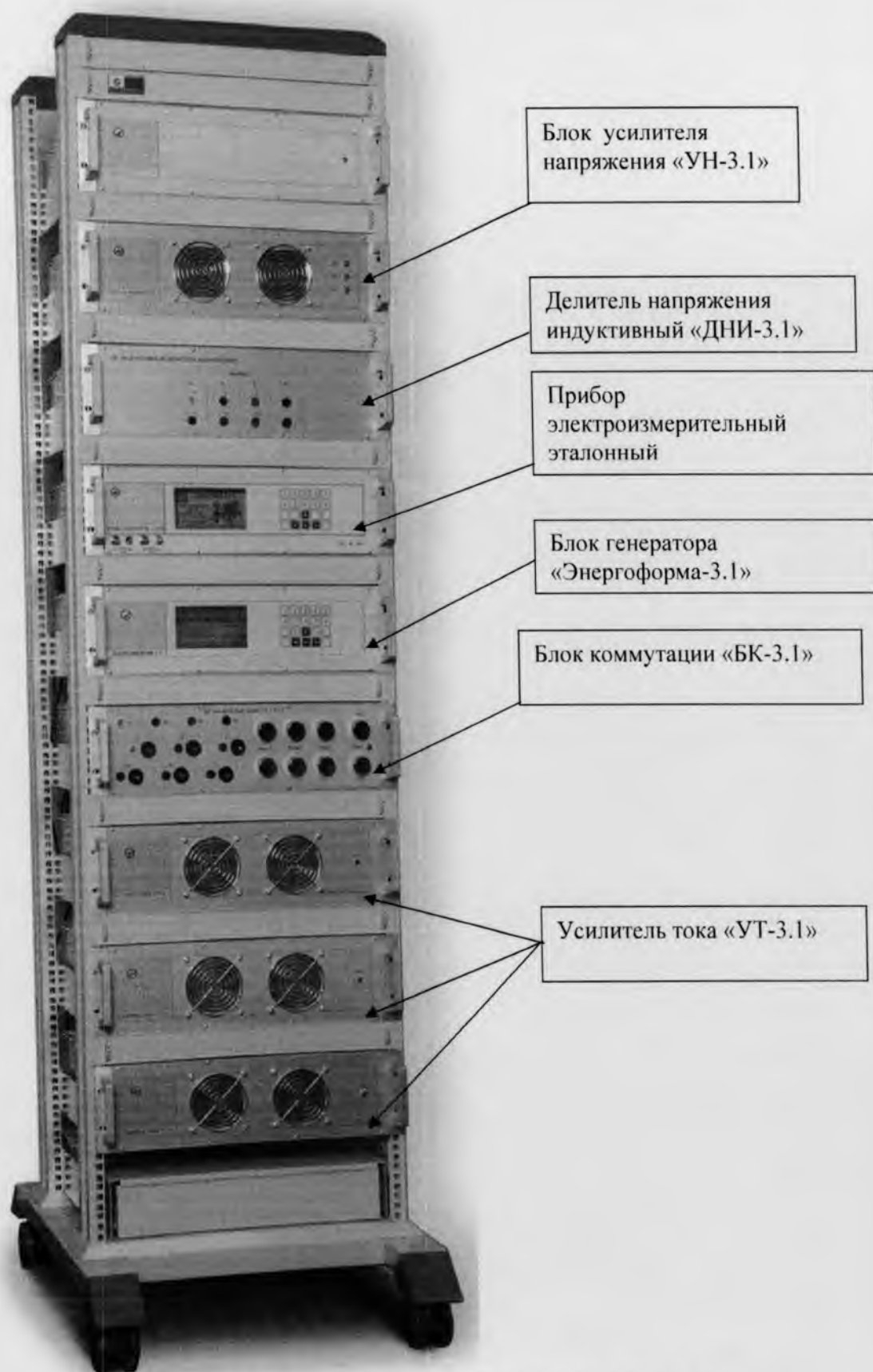
Рисунок 1. Установка "УППУ-МЭ 3.1КМ-С". Общий вид (Клеймо поверителя после поверки наносится на стационарную установку в виде наклейки на боковую стенку установки)