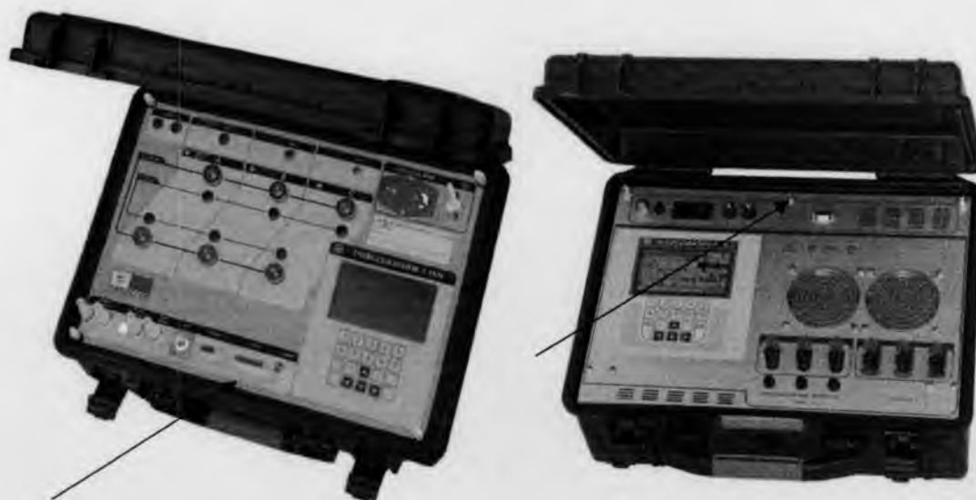
Рисунок 2. Установка "УППУ-МЭ 3.1КМ-П". Общий вид.