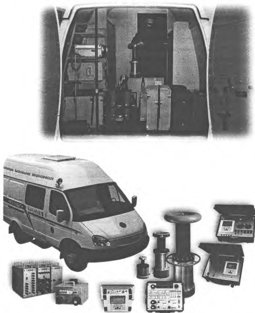
Рисунок 1. Общий вид ЛВМ МЭ-Аудит.

величин и показателей качества электрической энергии «Энергомонитор 3.3Т1» или прибор электроизмерительный эталонный многофункциональный «Энергомонитор 3.1КМ». Допускается применение прибора сравнения другого типа с характеристиками не хуже указанного. При поверке счетчиков электроэнергии в качестве эталонного средства измерения используется прибор «Энергомонитор 3.3Т1» или «Энергомонитор 3.1КМ». Допускается применение эталонного счетчика другого типа с характеристиками не хуже указанного.