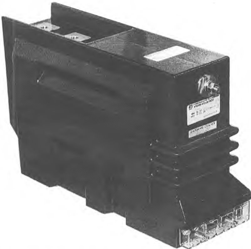
Таблица 1 – Характеристики трансформаторов напряжения в составе трансформаторов комбинированных НТОЛП-НТЗ