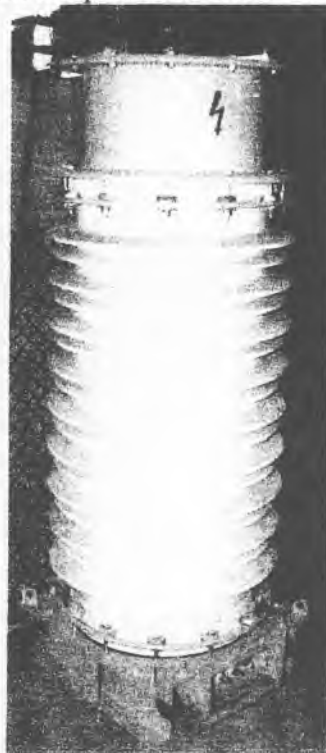
Рисунок 1 – Фотография общего вида трансформаторов напряжения НКФ-110-06

Общий вид трансформаторов напряжения НКФ-110-06 показан на рисунке 1.