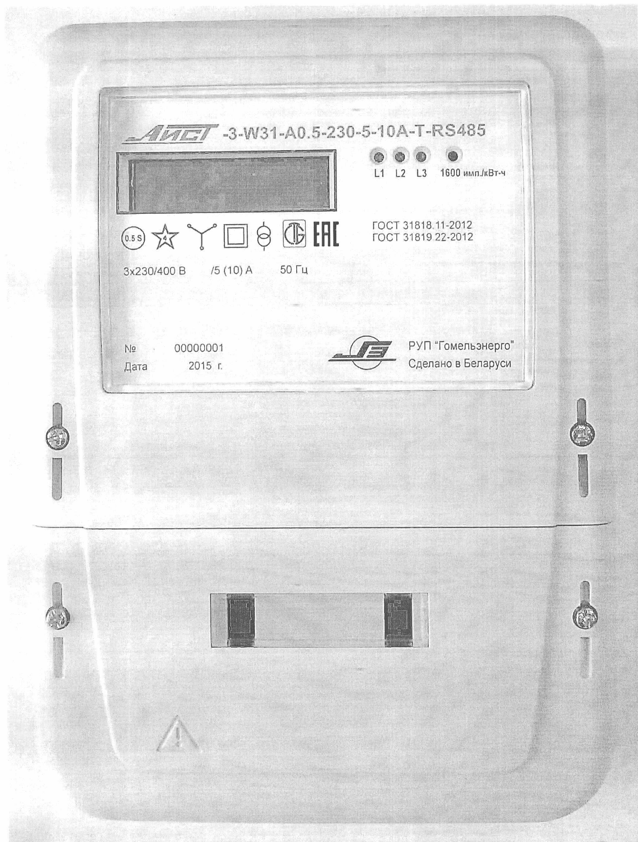
Рисунок 2 – Внешний вид счетчика в корпусе модификации W31

Внешний вид счетчиков представлен на рисунке 2. Схемы пломбирования счетчиков от несанкционированного доступа к элементам счетчика с указанием мест нанесения знаков поверки приведены в приложении А.