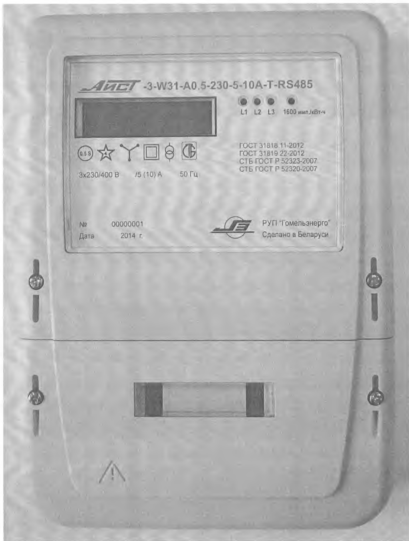
Рисунок 2 – Внешний вид счетчика в корпусе модификации W31

Внешний вид счетчиков представлен на рисунке 2. Схемы пломбирования счетчиков от несанкционированного доступа к элементам счетчика с указанием мест нанесения знаков поверки приведены в приложении А.