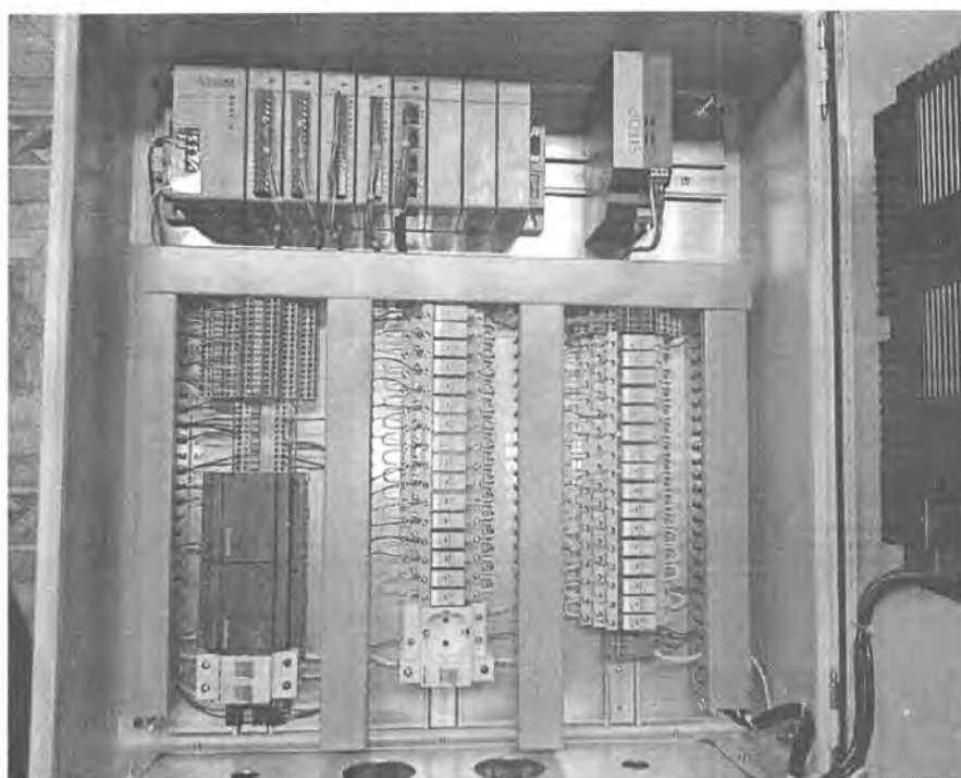
Рисунок 2 – Внутренний вид