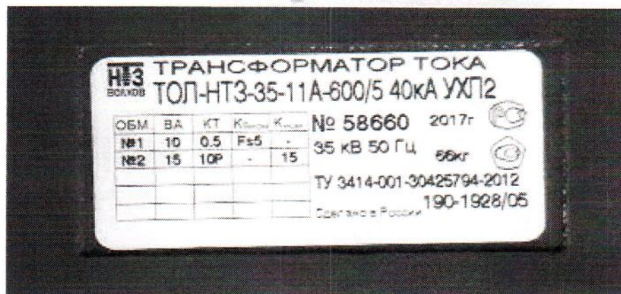
Рисунок 3 - Общий вид трансформаторов тока ТОЛ-НТЗ-35