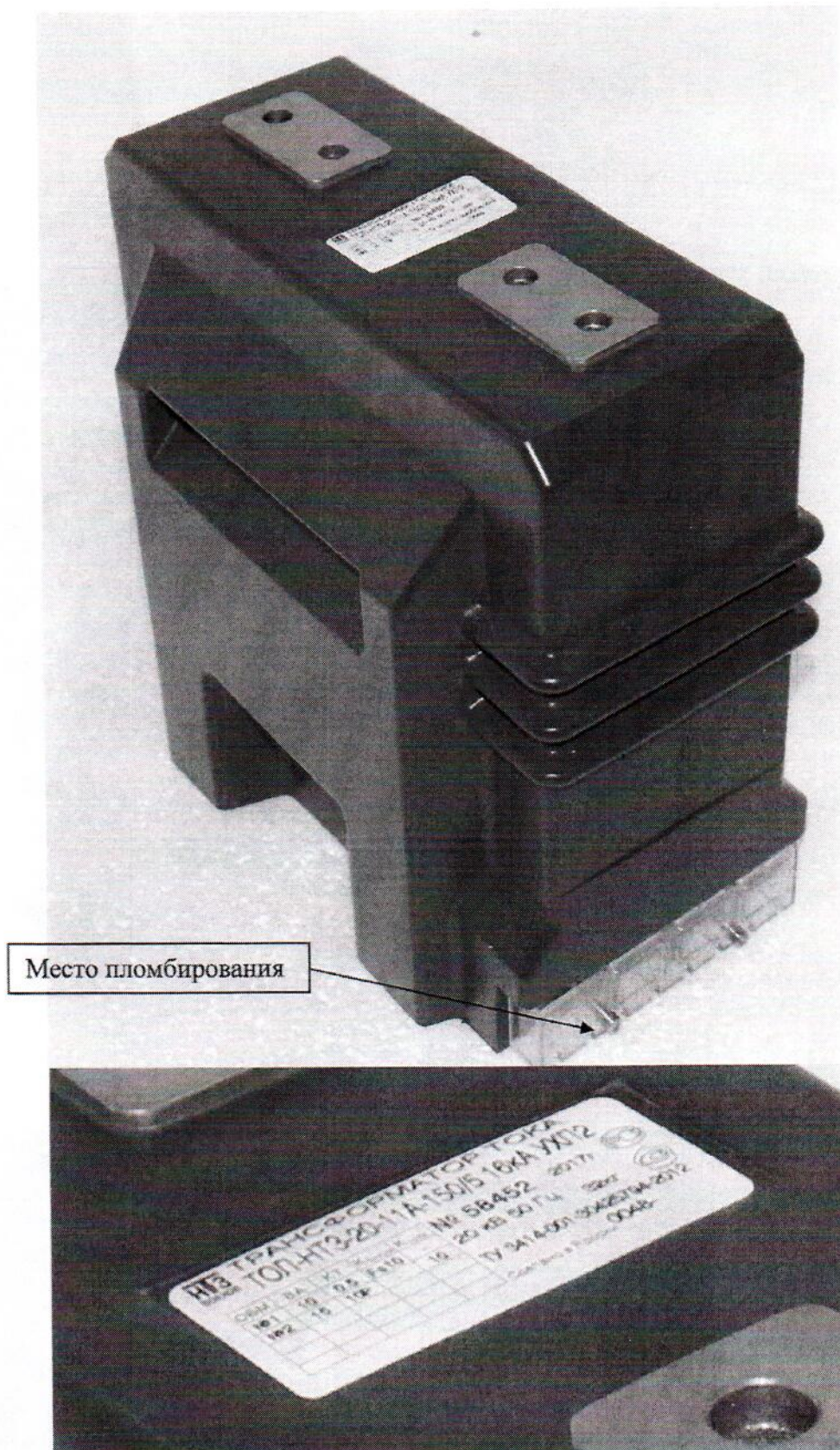
Рисунок 2 - Общий вид трансформаторов тока ТОЛ-НТЗ-20