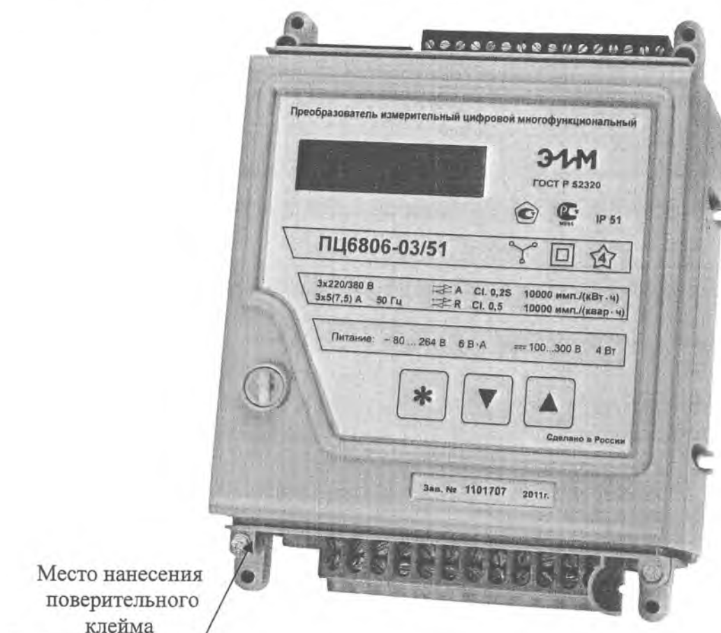
Рисунок 2 – Внешний вид ПЦ

Защита программного обеспечения ПЦ от непреднамеренных и преднамеренных изменений соответствует уровню А по МИ 3286-2010.