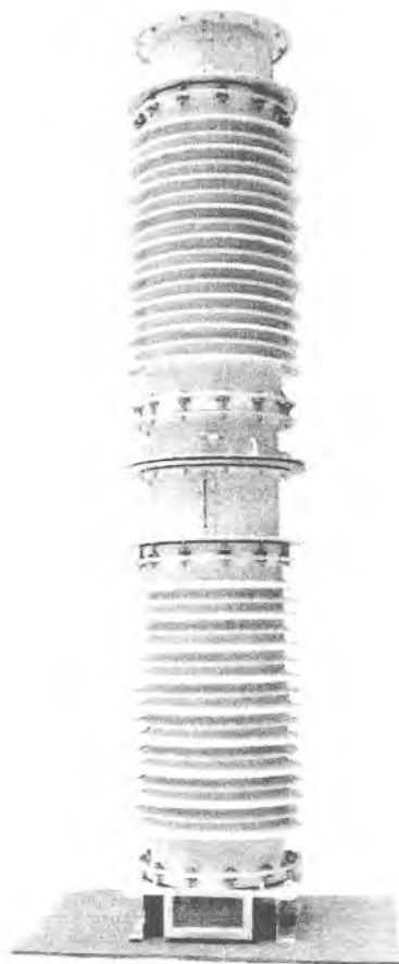
Рисунок 1 - Фотографии общего вида трансформаторов напряжения НКФ-220-06

Активная часть трансформаторов напряжения НКФ-220-06 находится в изоляционной крышке, заполненной трансформаторным маслом и установленной на основание.