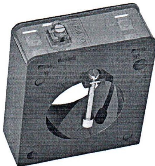
Рисунок 1 – Трансформаторы тока ТПП-Н-0,66

Внешний вид трансформаторов тока приведен на рисунке 1.