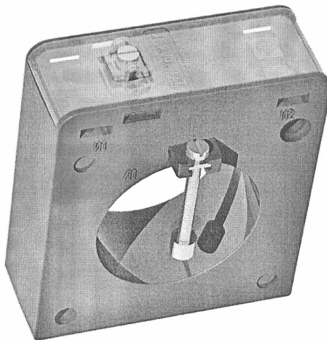
Рисунок 1 – Трансформаторы тока ТПП-Н-0,66

Внешний вид трансформаторов тока приведён на рисунке 1.