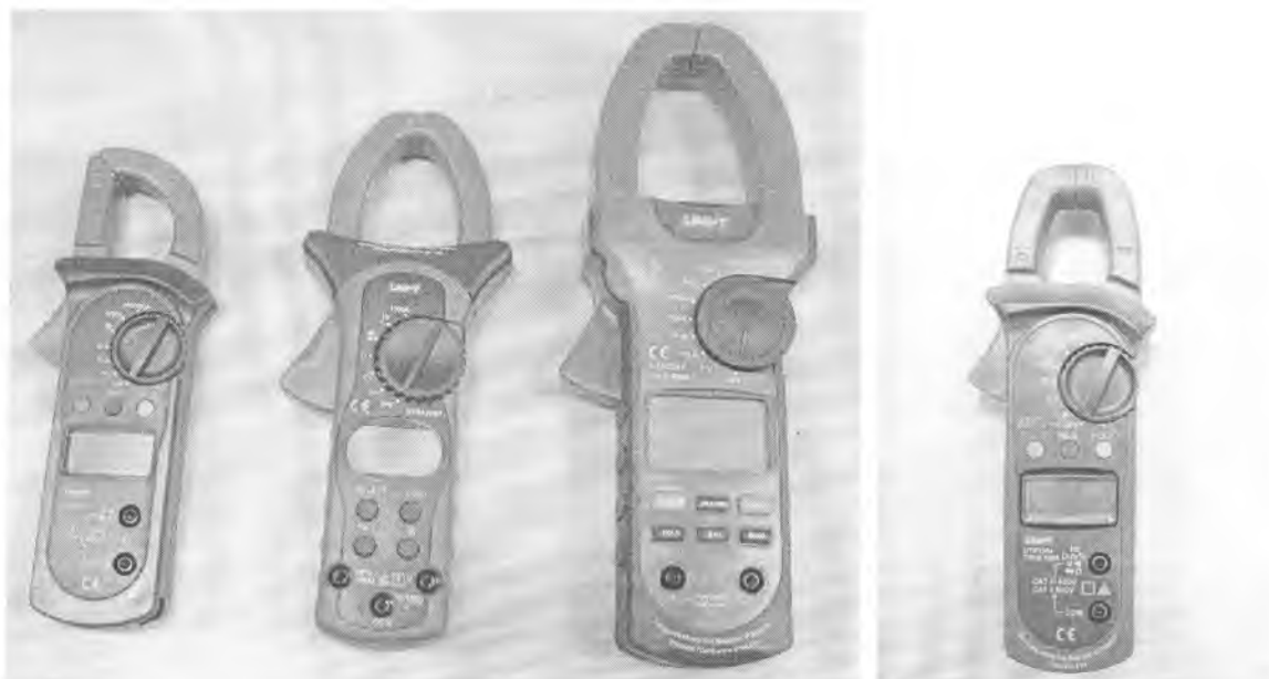
Рисунок 1. Общий вид клещей электроизмерительных цифровых серии UTB 320х.