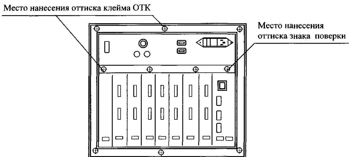
Рисунок А.1 – Место нанесения оттиска знака поверки (вид регистратора сзади)