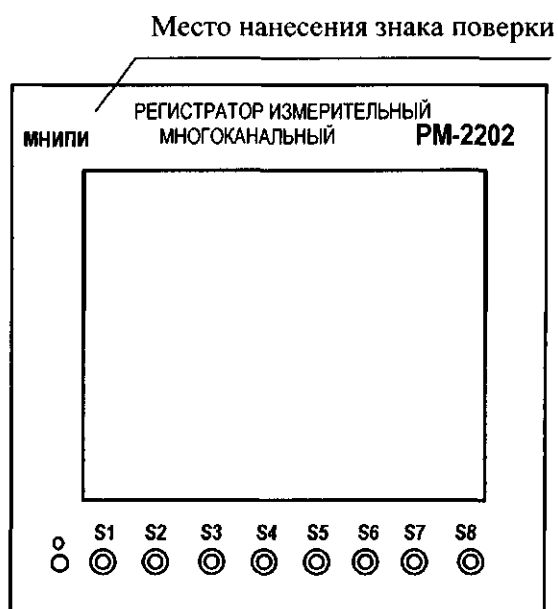
Рисунок А.2 – Место нанесения знака поверки (лицевая панель регистратора)