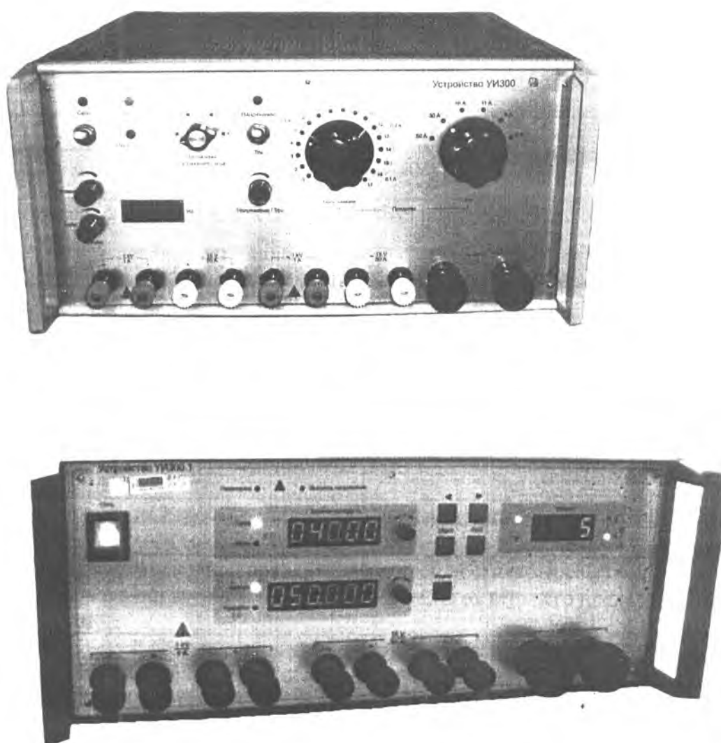
Рисунок 1 - Общий вид устройств

Общий вид устройств представлен на рисунке 1. Места нанесения поверительных клейм указаны на рисунке 2.