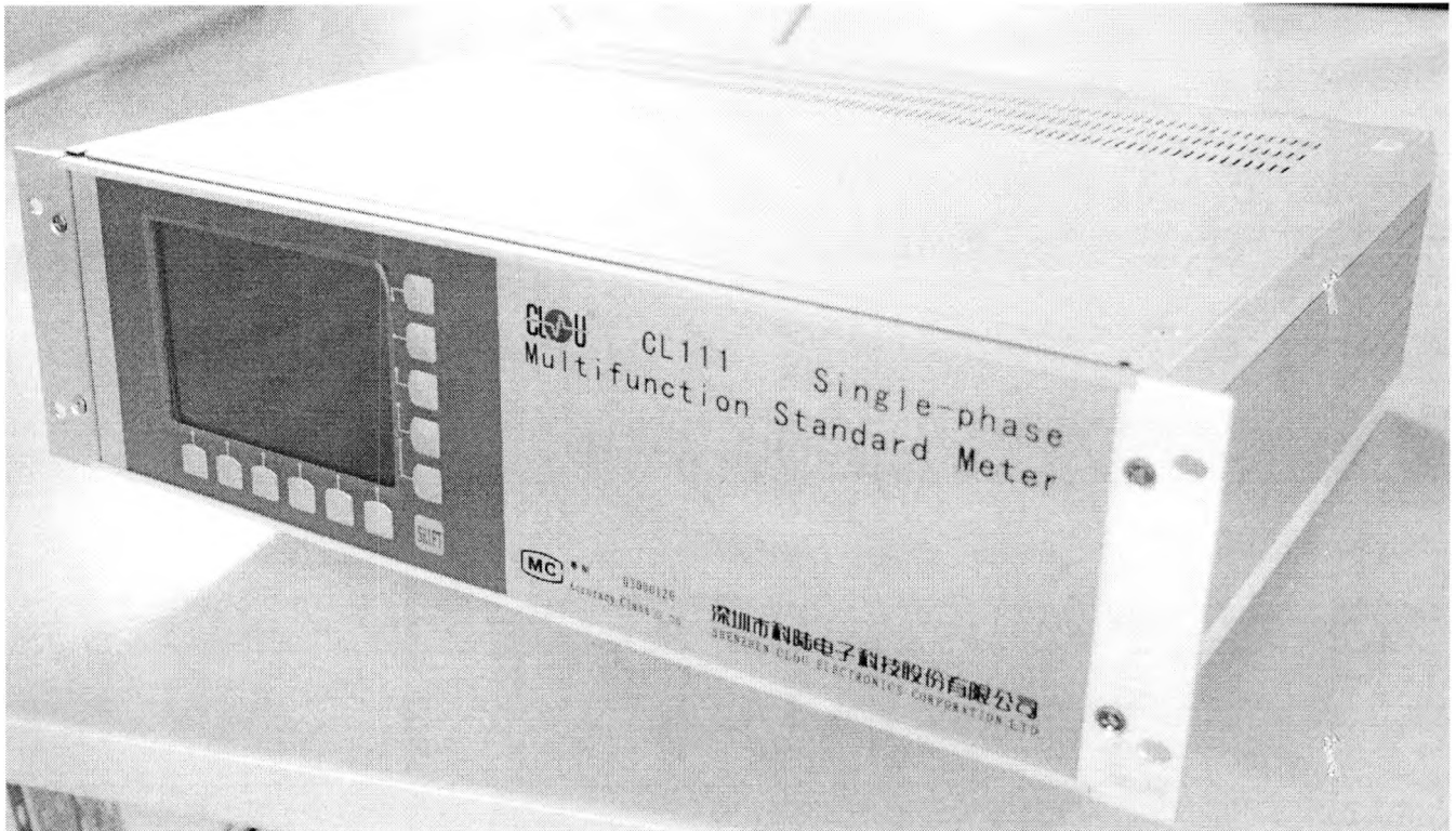
Рисунок 1 – Внешний вид счетчика CL111

Внешний вид счетчика CL111 приведен на рисунке 1.