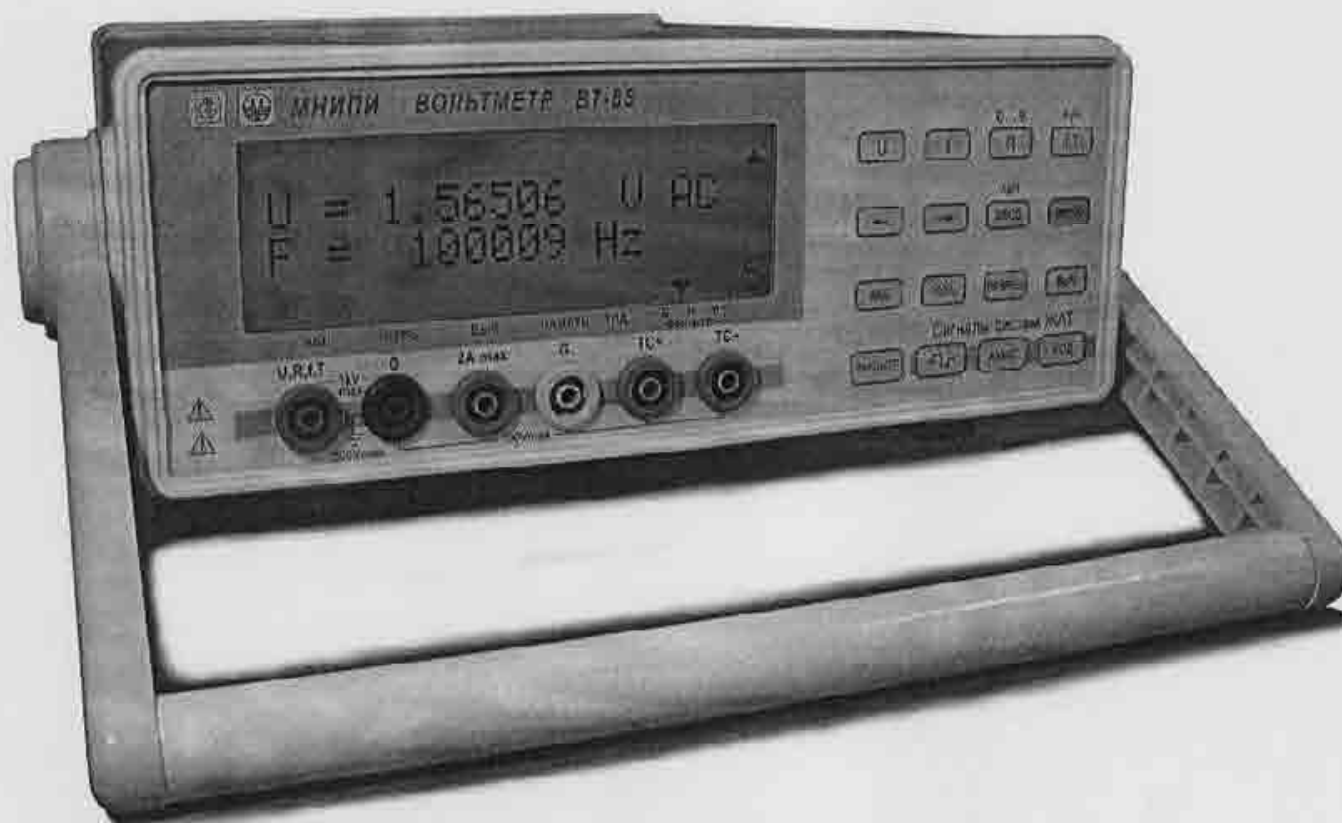
Рисунок 1 – Внешний вид вольтметра.