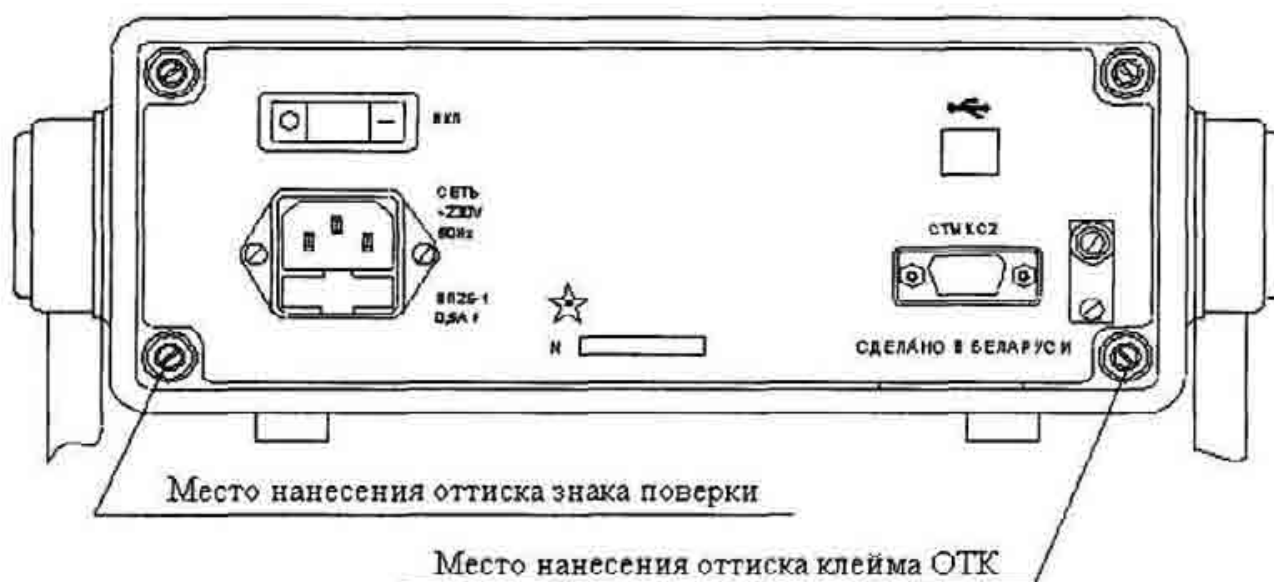
Рисунок А.2 - Место нанесения оттиска знака поверки и оттиска клейма ОТК (вид вольтметра сзади).