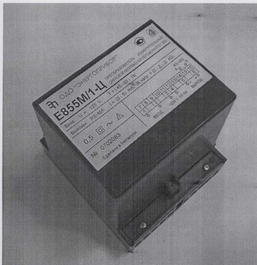
Рисунок 2 – Фотография общего вида

1 – место нанесения клейма ОТК, обеспечивающего защиту от несанкционированного доступа; 2 - место нанесения клейма поверителя