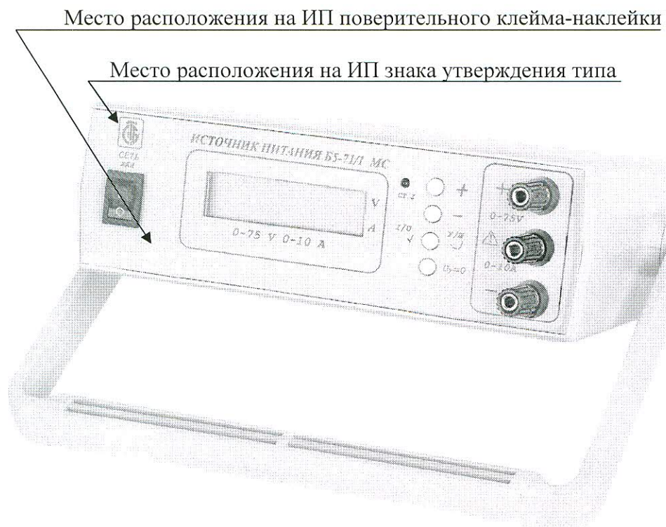
Рисунок А.1 Места расположения на ИП знака утверждения типа и поверительного клейма-наклейки.