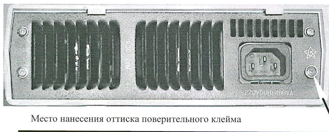
Рисунок А.2 Место нанесения отиска поверительного клейма.