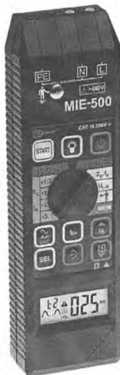
Рисунок 1. Общий вид измерителя параметров электробезопасности электроустановок MIE-500