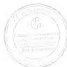
Рисунок А.1 Место нанесения поверительного клейма-наклейки

Место нанесения поверительного клейма-наклейки