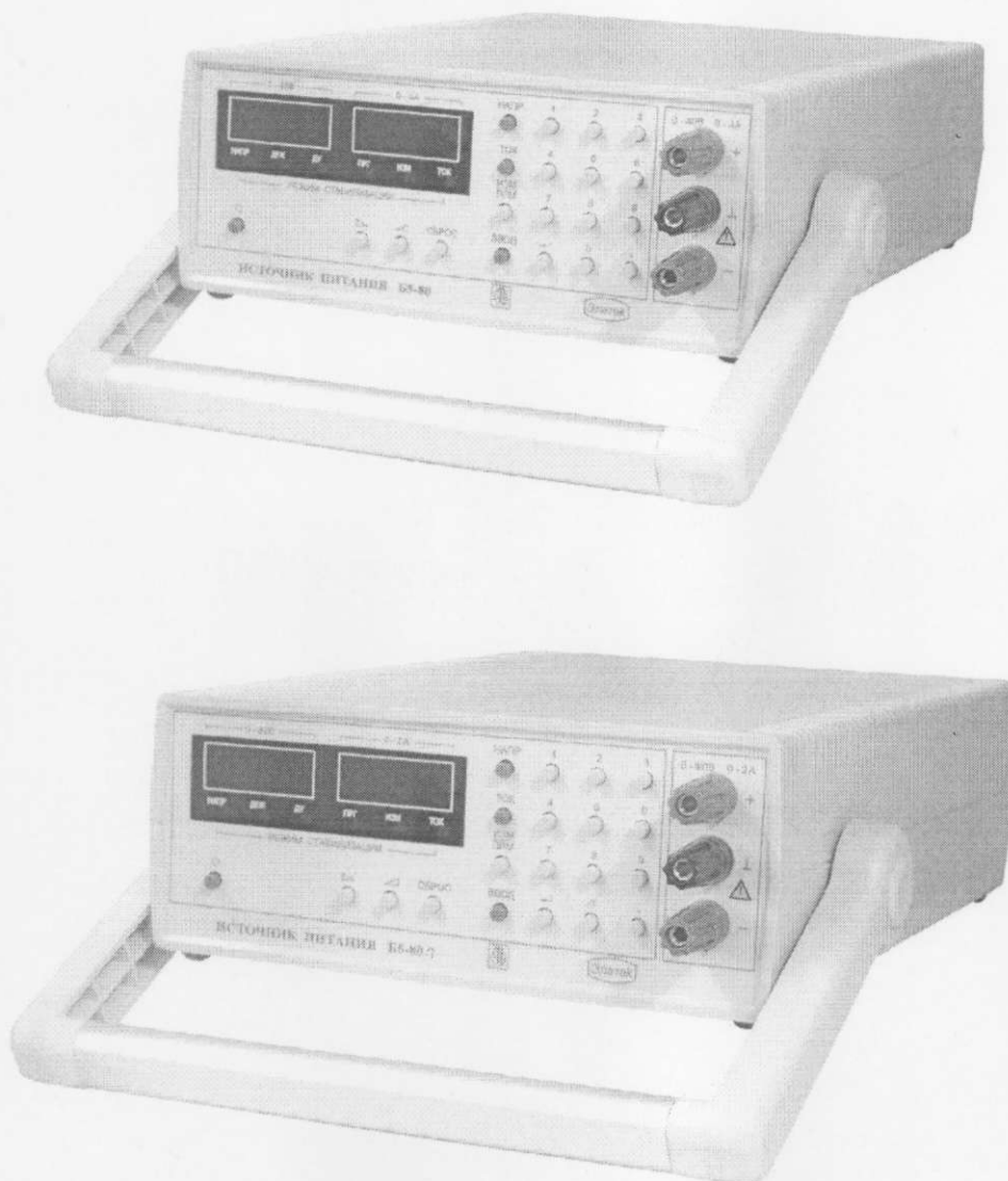
Рисунок 1 Внешний вид источников питания Б5-80 и Б5-80/1.