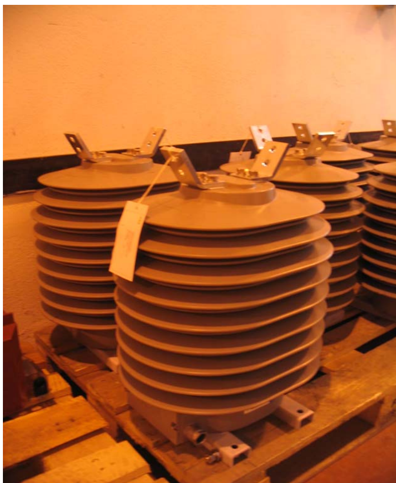
Рисунок 2 – Трансформаторы тока измерительные ТРО7.