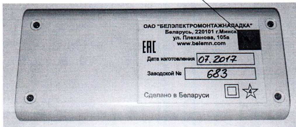
Рисунок А.1 – Место нанесения знака поверки (клеймо-наклейка).

Место нанесения знака поверки (клеймо-наклейка)