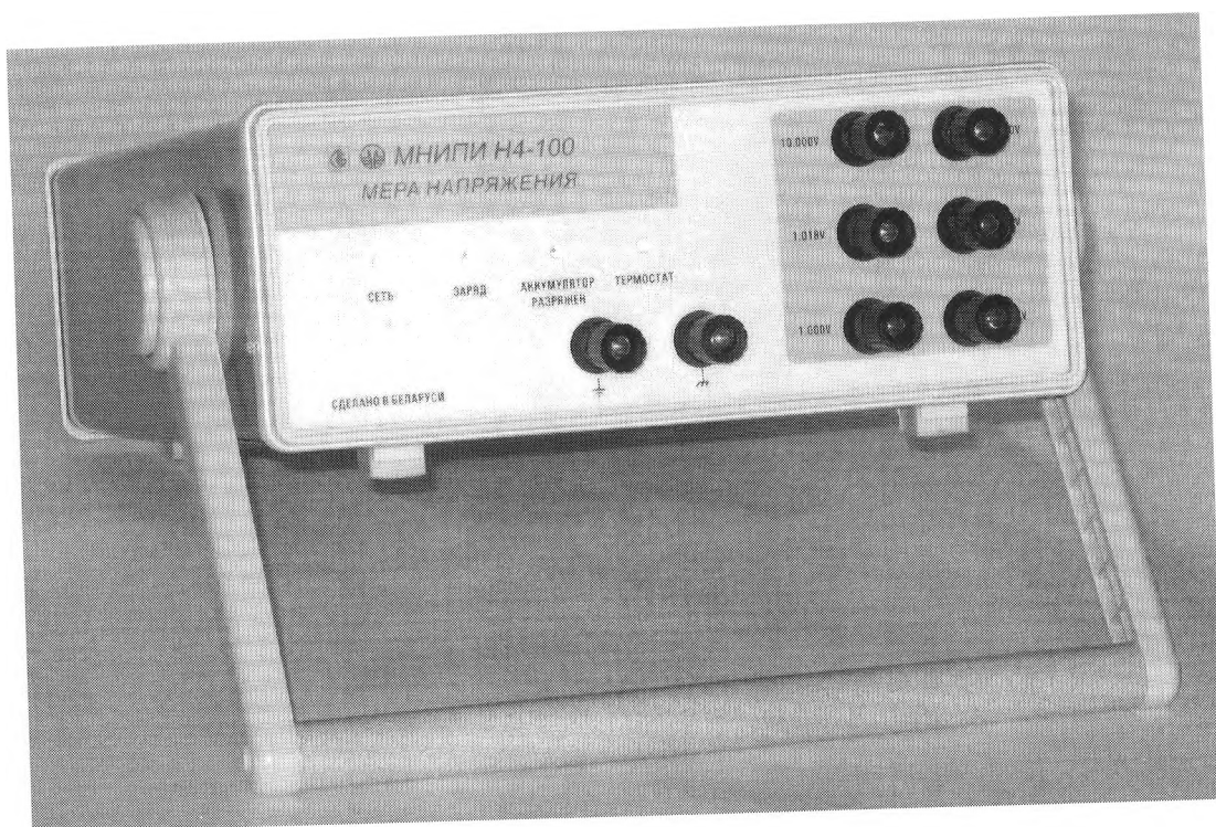
Рисунок 1 – Внешний вид меры напряжения