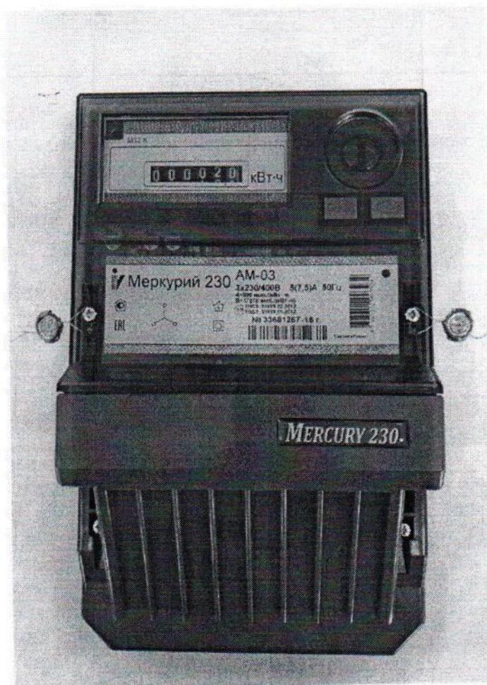
Рисунок 1- Общий вид счетчика с закрытой клеммной крышкой

Общий вид счётчиков электрической энергии трёхфазных статических «Меркурий 230АМ» представлен на рисунке 1.