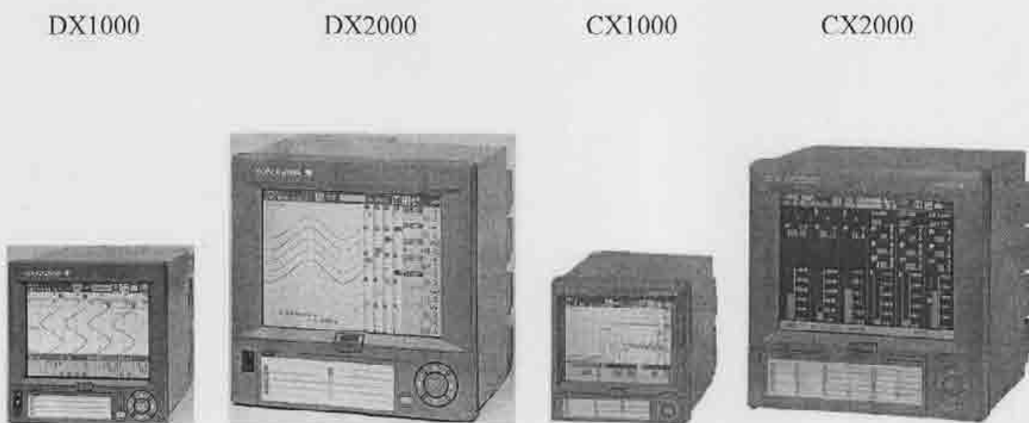
Рисунок 1 - Внешний вид регистраторов

Знак поверки (клеймо-наклейка) наносится на переднюю панель регистратора.