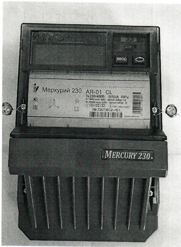
Рисунок 1 – Общий вид счетчика

Схема пломбировки от несанкционированного доступа, обозначение места нанесения знака поверки представлены на рисунке 2.