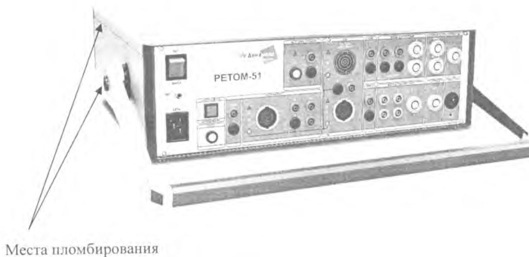
Рис. 1 – Внешний вид устройства РЕТОМ-51