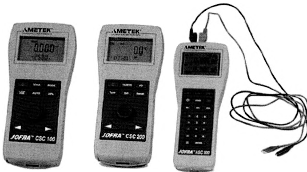
Рисунок 1 - Внешний вид калибраторов

Внешний вид калибраторов приведен на рисунке 1. Место нанесения знака поверки (клеймо-наклейка) указано в приложении А к описанию типа.