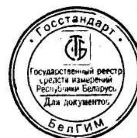
Схема пломбировки от несанкционированного доступа с указанием мест для нанесения оттисков клейм и расположения наклеек приведена в приложении Б.

Фотография общего вида ИП приведена в приложении А.