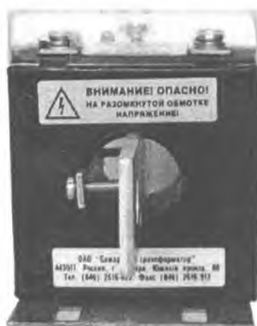
Рисунок 1 – Фотография общего вида трансформаторов тока Т-0,66

Принцип действия трансформаторов тока заключается в преобразовании переменного тока промышленной частоты в переменный ток для измерения с помощью стандартных измерительных приборов, а также обеспечения электрической изоляции измерительных устройств от цепей высокого напряжения.