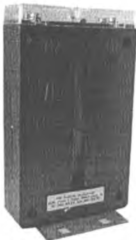
Рисунок 1 – Фотография общего вида трансформаторов тока ТШ-0,66

Принцип действия трансформаторов тока заключается в преобразовании переменного тока промышленной частоты в переменный ток для измерения с помощью стандартных измерительных приборов, а также обеспечения электрической изоляции измерительных устройств от цепей высокого напряжения.