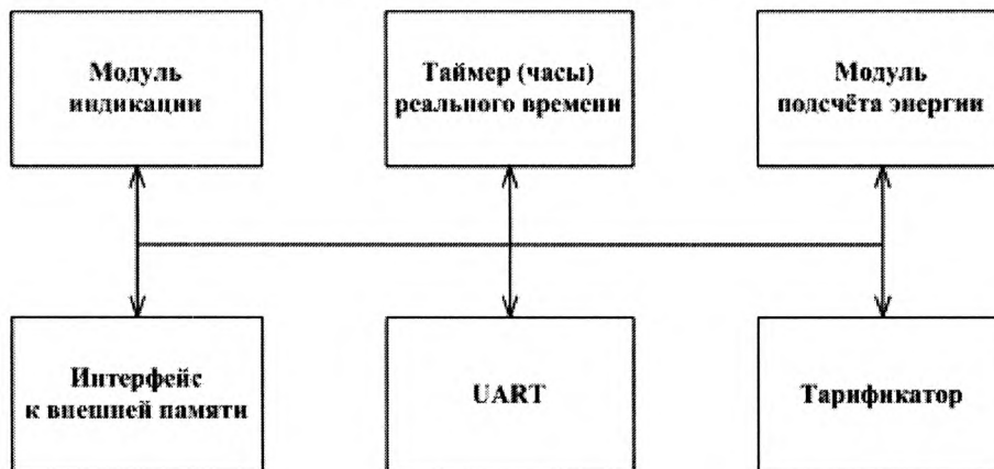
Рисунок 3 - Структура программного обеспечения «Меркурий 200»

Структура программного обеспечения «Меркурий 200» приведена на рисунке 3.