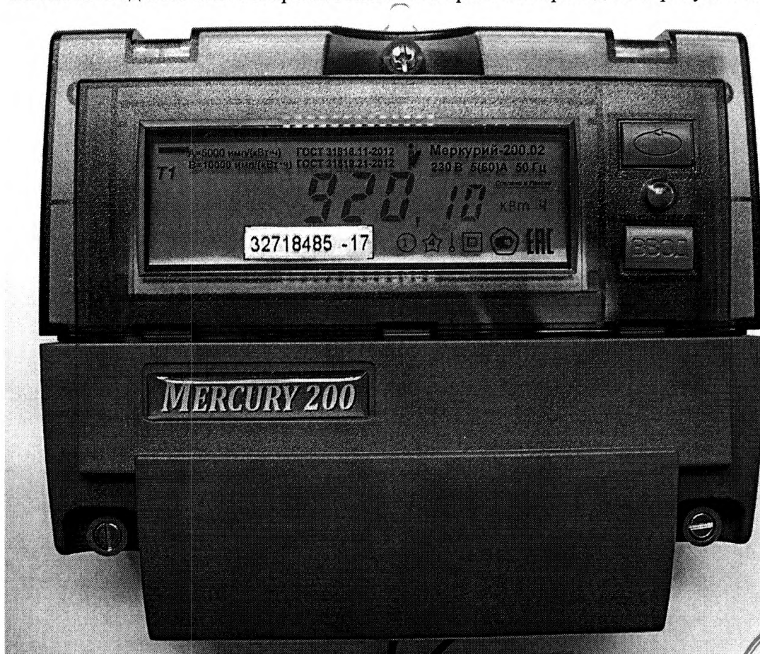
Рисунок 1 - Внешний вид счетчика с закрытой клеммной крышкой

Внешний вид счетчика с закрытой клеммной крышкой приведен на рисунке 1.