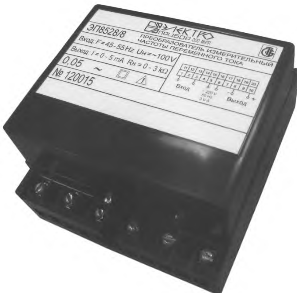
Рисунок 1 – Фотография общего вида ИП