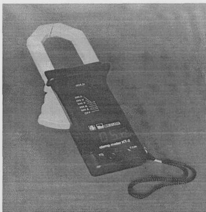
Рисунок 1 – Общий вид клещей