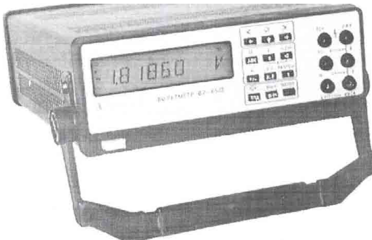
Рисунок 1 - Общий вид вольтметров

Место нанесения на вольтметрах оттиска поверительного клейма и поверительного клейма наклейки приведено в приложении А.