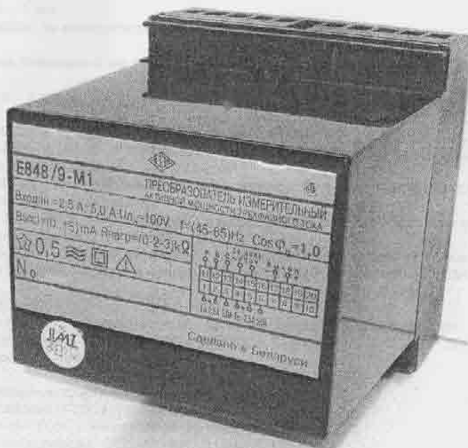
Рисунок 2 – Фотография общего вида